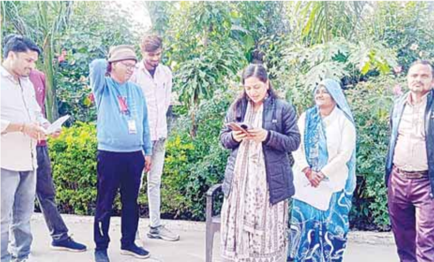
शहडोल। जिले की जनपद पंचायत