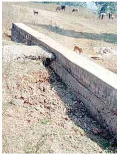
लाख पचास हजार की पुल का निर्माण किया गया था पर साल भर नहीं चल पाई पुल पूरी तरह से जर जर हो गया ये पुल का निर्माण सरपंच के खास लोगों ने किया था