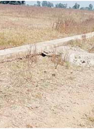
सिकेटरी मिल जुल कर पंचायत का काम करा रहे हैं अभी पिछले साल बनी गांधी ग्राम में तीन