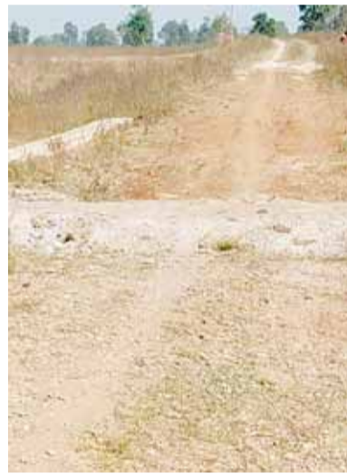
घुनघुटी पंचायत में सरपंच पति व